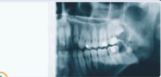
Prawa strona do redukcji dawki przy prześwietleniu kontrolnym