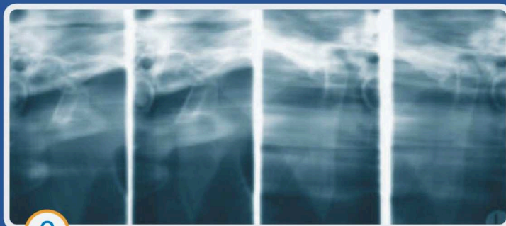
Stawy szczękowo-żuchwowe z boku przy otwartych i zamkniętych ustach na jednym filmie