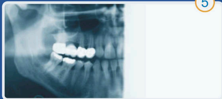
Lewa strona do redukcji dawki przy prześwietleniu kontrolnym