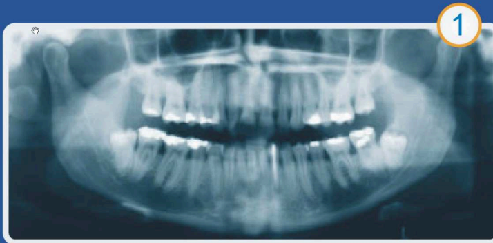
Standardowe zdjęcie panoramiczne

Przyjmujemy pacjentów ze skierowaniami na wykonanie następujących rodzajów zdjęć pantomograficznych